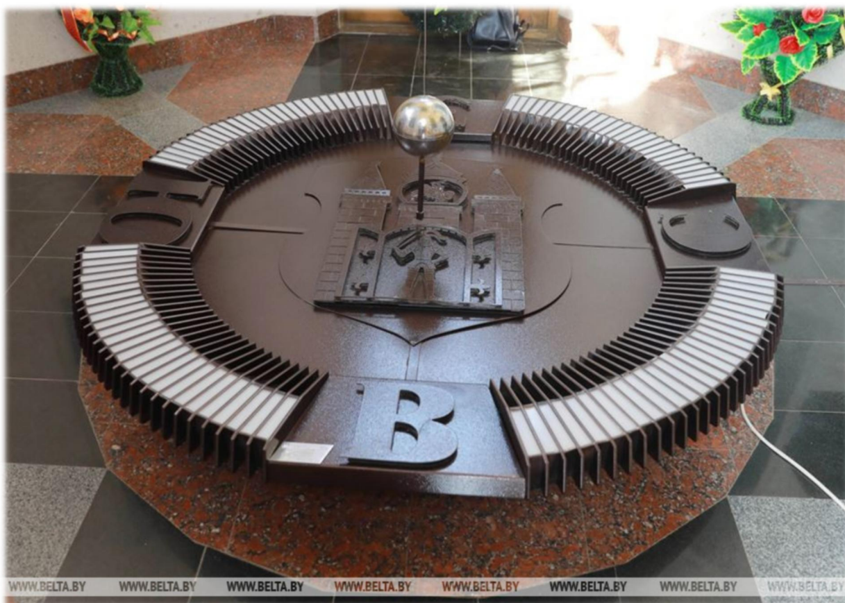
"Книга памяти" в каплице Буйничского мемориала

Внутри стены часовни облицованы светлым мрамором. На них размещены мемориальные доски с сотнями фамилий воинов и народных ополченцев, участвовавших в обороне Могилева. На возвышенности в центре - "Книга памяти" Буйничского мемориала. Под часовней находится склеп, предназначенный для перезахоронения останков погибших воинов Красной Армии, обнаруженных на полях боев в окрестностях Могилева.